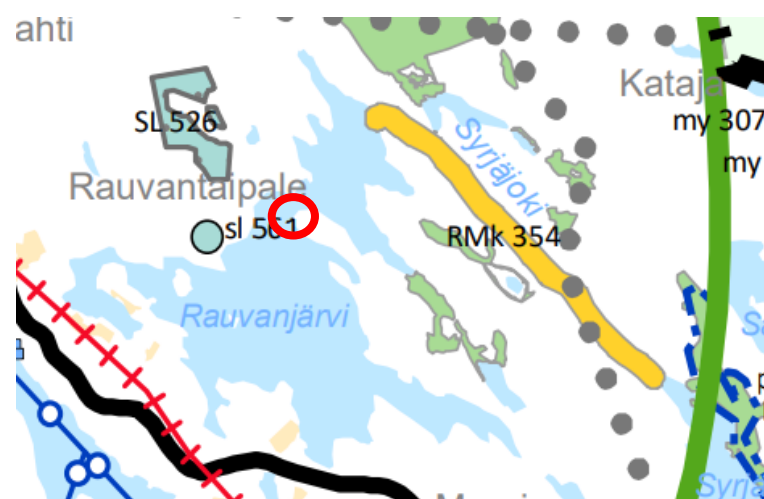
Kuva 4. Ote Pohjois-Savon maakuntakaavan 2040 2. vaiheen uudesta ehdotuksesta. Suunnittelualueen sijainti on osoitettu punaisella ympyrällä.

Pohjois-Savon maakuntakaava 2040 2.vaiheen laatiminen on käynnissä. Kaavaehdotus on uudelleen nähtävillä 2.–31.10.2024. Suunnittelualue sijoittuu maakuntakaavan matkailun ja virkistystyksen kehittämisvyöhykkeelle. Merkinnällä osoitetaan vähintään maakunnallisesti merkittäviä virkistystyksen ja luontomatkailun alueita, joiden ytimenä on kansallispuisto tai muu luontomatkailun kohde.